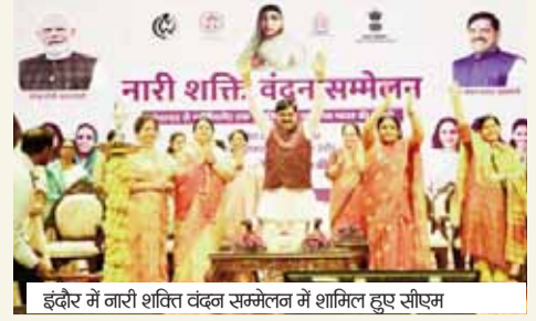
हरिभूमि व्यूज ॥ गोपाल

सीएम बोले : महिलाओं के लोकतांत्रिक अधिकारों को मिलेगी अब नई ऊंचाइयां