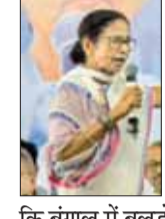
पिंगला में बुलडोजर चलते रहेंगे। यहां से जब लड़के-लड़कियां भाजपा शासित राज्य में जाते हैं, तो उन्हें मार दिया जाता है।

पिंगला। बंगाल विधानसभा चुनाव के लिए राजनीतिक दलों का चुनाव प्रचार जारी है। इस बीच ममता ने पिंगला में जनता को संबोधित करते हुए योगी आदित्यनाथ पर निशाना साधा है। उन्होंने कहा कि बंगाल में बुलडोजर नहीं चलता है बल्कि यहां पर लोग सलाम, प्रणाम और जय हिंद कहते हैं। आजकल उत्तर प्रदेश जल रहा है। योगी बाबू यहां आकर भाषण देते हैं और कहते हैं कि बंगाल में बुलडोजर चलते रहेंगे। यहां से जब लड़के-लड़कियां भाजपा शासित राज्य में जाते हैं, तो उन्हें मार दिया जाता है। उन्हें प्रताड़ित किया जाता है। जब वे बंगाली बोलते हैं, तो उन्हें घुसपैठिया कहा जाता है। उनका बदला लोकतंत्र के बिलेट बाँक्स में लिया जाएगा। परिसीमन विधेयक आपको टुकड़ों में काट देगा।