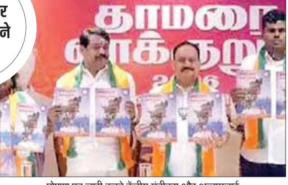
घोषणा पत्र जारी करते केंद्रीय मंत्रीनड्डा और अन्नामलाई

तमिलनाडु के लिए भाजपा ने घोषणापत्र जारी किया, सभी वर्गों को साधने की कोशिश की