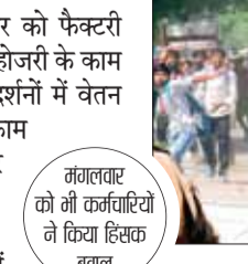
हरियाणा सरकार ने इसी महीने फैक्टरी-उद्योगों से जुड़े कर्मियों के न्यूनतम वेतन में 35 फीसदी की बढ़ोतरी करने का फैसला लिया। यहां तृणमूल कर्मियों को अब लगभग 11,274 से बढ़कर 15,220 रुपए मिल रहे हैं, सभी को वेतन बढ़े हैं।