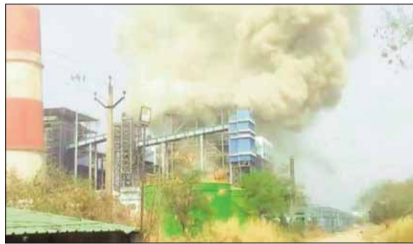
वेदांता पावर प्लांट में विस्फोट

कंपनी के प्रवक्ता ने कहा कि सब-कॉन्ट्रैक्टर एनजीएसएल के कर्मचारी प्रभावित