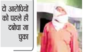
हरिभूमि व्यूज ॥ भुरेना

ट्रेक्टर से कुचलकर वन आरक्षक की हत्या की थी मुख्य आरोपी अहमदाबाद से गिरफ्तार सलाखों के पीछे पहुंचे तीनों आरोपी