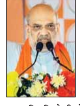
दुर्गापुर में अमित शाह के रोड शो के समाप्त होते ही पूरे इलाके में तनाव फैल गया।

दुर्गापुर में अमित शाह के रोड शो के समाप्त होते ही पूरे इलाके में तनाव फैल गया। बांकुड़ा मोड़ इलाके में तृणमूल कांग्रेस (टीएमसी) और भारतीय जनता पार्टी (बीजेपी) के कार्यकर्ताओं के बीच कहासुनी से शुरू होकर मामला हाथापाई तक पहुंच गया। स्थिति तेजी से बिगड़ गई और दोनों पक्षों के कम से कम दो कार्यकर्ता घायल हो गए। घायलों को रक्तरीजित अवस्था में दुर्गापुर महकमा अस्पताल में भर्ती कराया गया।