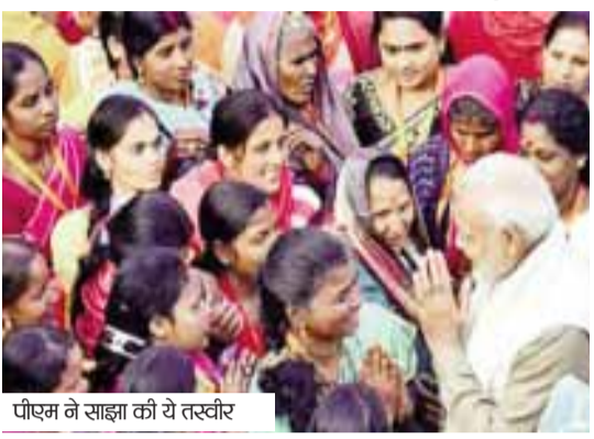
पीएम ने साझा की ये तस्वीर

इन बदलावों के पास होने के बाद लोकसभा की कुल सीटें बढ़कर 816 हो जाएंगी। इनमें से 273 सीटें महिलाओं के लिए आरक्षित रहेंगी। पीएम मोदी ने इस ऐतिहासिक कदम के लिए देश की करोड़ों महिलाओं से आशीर्वाद मांगा है। उन्होंने महिलाओं से एक खास अपील भी की है। उन्होंने कहा कि महिलाएं अपने क्षेत्र के सांसदों को पत्र लिखें। वे सांसदों को इस ऐतिहासिक सत्र में हिस्सा लेने के लिए प्रोत्साहित करें। प्रधानमंत्री ने सोशल मीडिया पर भी यह पत्र साझा किया है।