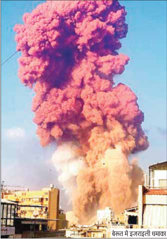
बेरुत में इजराइली धमाका

जबलपुर, बुधवार 15 अप्रैल 2026 haribhoomi.com