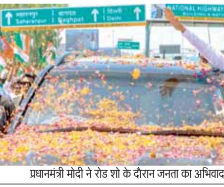
प्रधानमंत्री मोदी ने रोड शो के दौरान जनता का अभिवादन किया

पीएम नरेंद्र मोदी ने मंगलवार को दिल्ली-देहरादून इकोनॉमिक कॉरिडोर का लोकार्पण किया। सबसे पहले सिद्धपीठ मां काली का आशीर्वाद लिया। इसके बाद पीएम मोदी का रोड शो हुआ। पहली बार राजधानी दून में 12 किमी का रोड शो किया। इसके बाद गढ़ी कैट स्थित मैदान से जनसभा को संबोधित किया। इस दौरान चम्पे-चम्पे पर कड़ी सुरक्षा रही। प्रधानमंत्री बनने के बाद 5 बार केदारनाथ आ चुके हैं, साथ ही बदरीनाथ व मुखबा का भी दौरा कर चुके हैं। पिछले मार्च में उत्तरकाशी जिले में मां गंगा के शीतकालीन प्रवास स्थल मुखबा में प्रधानमंत्री ने शीतकालीन यात्रा का संदेश दिया था। एलिवेटेड रोड पर भी पीएम मोदी ने कार से उतरकर निरीक्षण किया। सिर पर ब्रह्मकमल टोपी, भाषण में गढ़वाली-कुमाऊंजी, पीएम मोदी ने जनता का दिल जीत लिया। जनसभा स्थल में लोगों की भारी भीड़ रही।