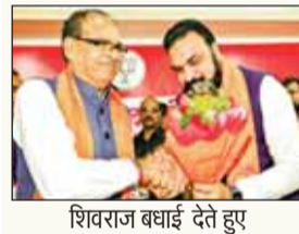
नीतीश के साथ सम्राट