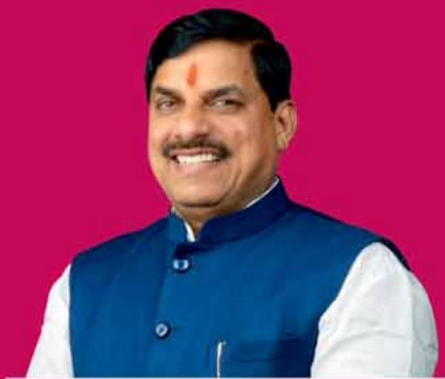
डॉ. मोहन यादव मुख्यमंत्री, मध्यप्रदेश