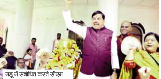
महू में संबोधित करते सीएम

अंतर्जातीय विवाह पर सरकार प्रोत्साहन राशि के रूप में 2 लाख रुपए दे रही मुख्यमंत्री ने कहा कि बाबा साहेब ने अपने जीवन के प्रत्येक क्षण भारत माता की आराधना करते हुए समाज को आगे बढ़ाने का रास्ता दिखाया था। उन्होंने कहा कि भीम जन्मभूमि पर होली-दीवाली जैसा माहौल है। बाबा साहेब के जीवन से जुड़े सभी 5 पड़ावों को हमारी सरकार ने पंचतंत्र के रूप में विकसित किया है। जातिगत असमानता को खत्म करने के लिए अंतर्जातीय विवाह करने पर नवदंपतियों को हमारी सरकार प्रोत्साहन राशि के रूप में 2 लाख रुपए दे रही है। मुख्यमंत्री ने कहा कि अनुसूचित जाति-जनजाति के कल्याण के लिए सरकार ने सालाना बजट का एक तिहाई हिस्सा इन्हें समर्पित किया है।